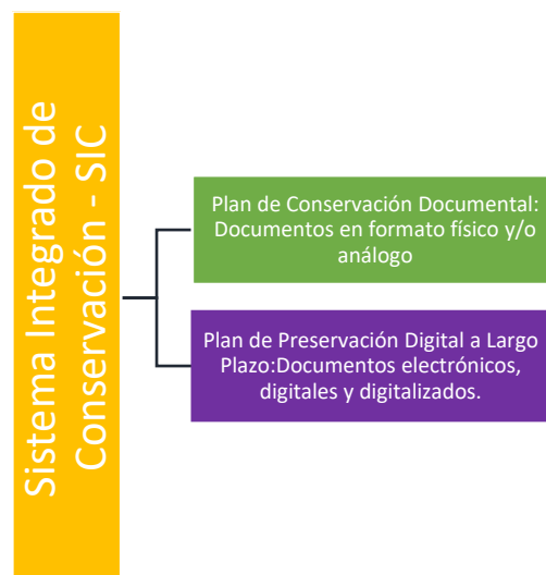
Gráfico N°1. Componentes del SIC.

Este documento cuenta con la estructura descrita en el del Acuerdo 006 del 2014 emitido por el Archivo General de la Nación - AGN, en el cual se describen los dos (2) componentes principales del sistema: Plan de Conservación Documental y Plan de Preservación a Largo Plazo, abarcando cualquier formato en el que se puedan producir documentos en cualquier etapa de archivo.