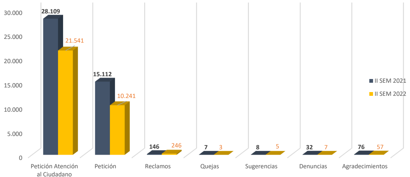
Grafica 2. Total, de PQRDS por tipo de solicitud