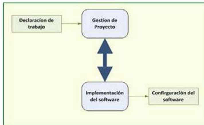
Fig. 1 Procesos del perfil básico

La norma ISO 29110, busca promover la formalización de los procesos de ingeniería de software en entidades muy pequeñas para ofrecer el más alto nivel de calidad en los productos de ingeniería de software cumpliendo las expectativas del cliente y usuarios de los productos, por otra, la ISO 29110, describe los criterios y directrices respecto a los procesos de gestión de proyectos e implementación del software indicando actividades y tareas de los dos procesos, así como un conjunto de documentos que se deben producir durante la ejecución del proceso y los roles que intervienen en la ejecución de las tareas.