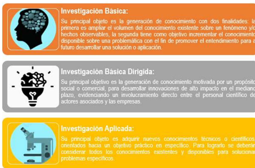
Figura 2.1 Objetivos principales de los proyectos de investigación científica