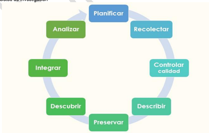
Gráfica 1. Ciclo de vida de los Datos de Investigación

La gestión de este tipo de datos se define como un conjunto estructurado de actividades que buscan facilitar la identificación, recopilación, creación, almacenamiento, calidad, transferencia, distribución y uso de los datos (M. A. Osorio-Sanabria, 2016). Según la organización DataONE (Data Observation Network for Earth) y basada en lo propuesto por Strasser et al. (2012), la gestión de estos datos desde la perspectiva del investigador se lleva a cabo a través de un ciclo de ocho fases tal como se presenta en la Gráfica 1.