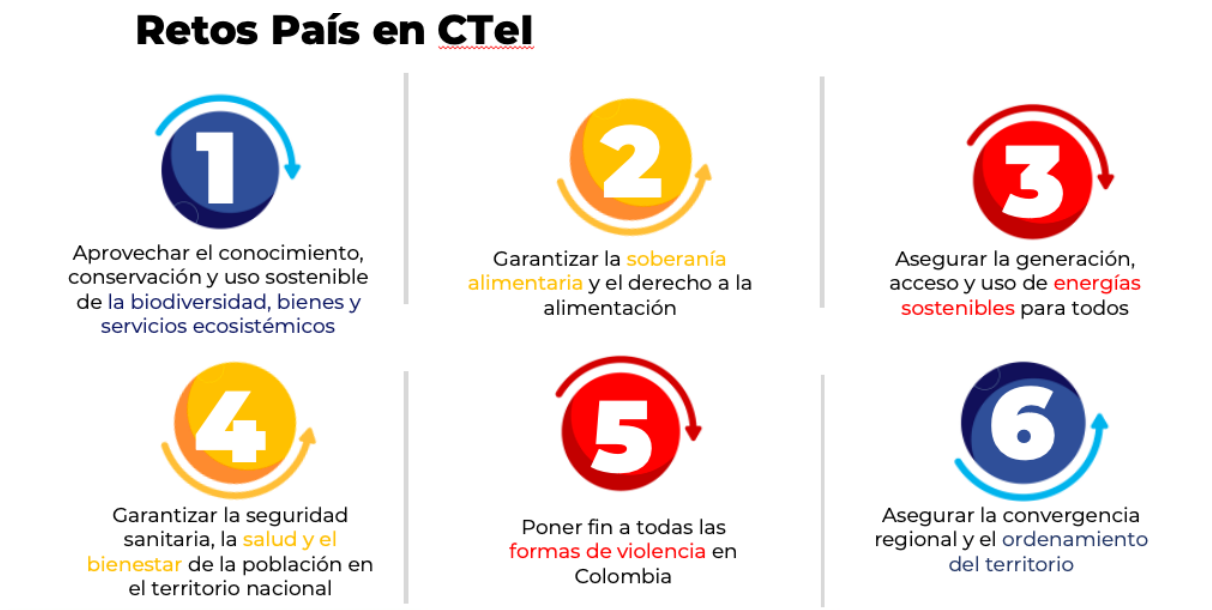
Imagen 2. Retos en los cuales se enmarcaron las demandas territoriales.