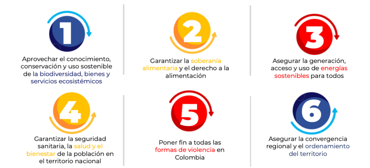
Imagen 2. Retos en los cuales se enmarcaron las demandas territoriales.