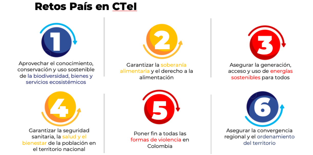
Imagen 2. Retos en los cuales se enmarcaron las demandas territoriales.