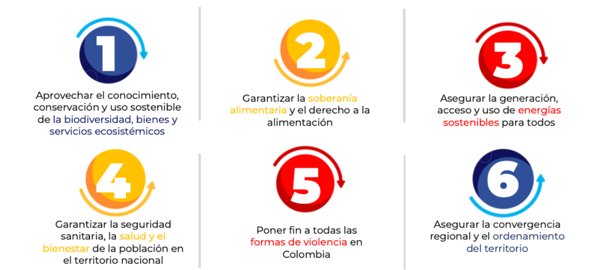
Imagen 2. Retos en los cuales se enmarcaron las demandas territoriales.