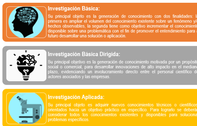
Figura 1 Objetivos principales de los proyectos de investigación científica