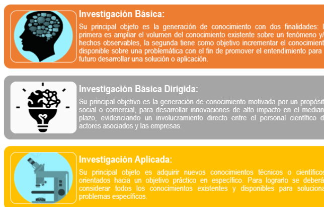
Figura 1 Objetivos principales de los proyectos de investigación científica